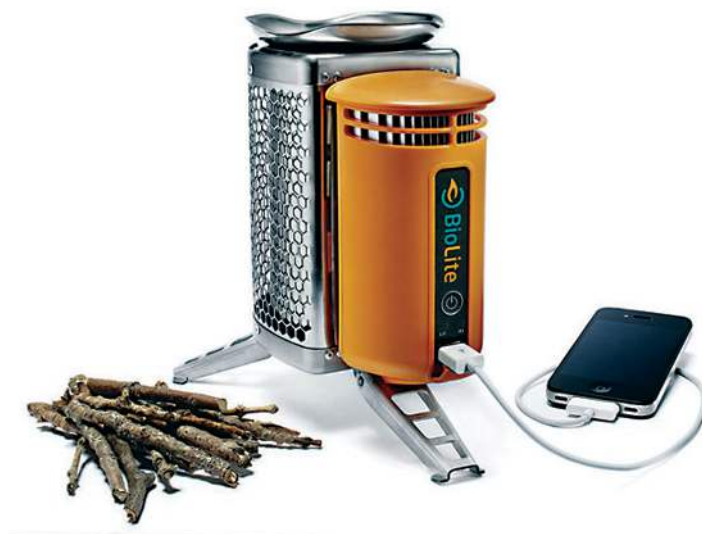
Figura 6: Estufa Biolite