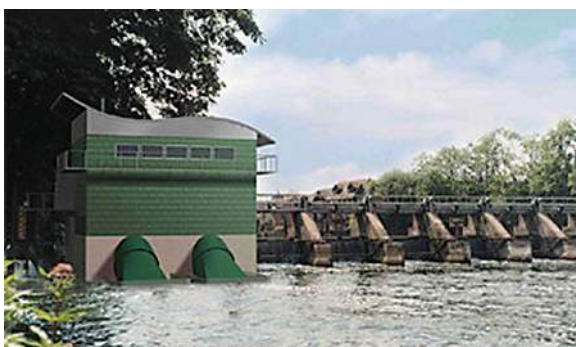
Figura 2: Esclusa Romney