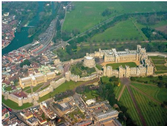
Figura 1: Castillo de Windsor