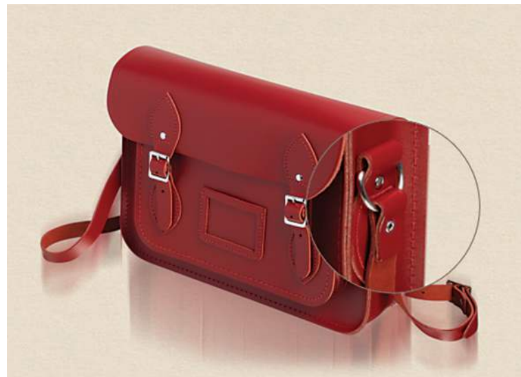
Figura 5: Detalle de la unión de la correa con el bolso