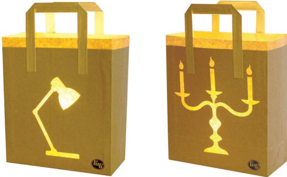
Figura 7: Lámpara de mesa Bagalight